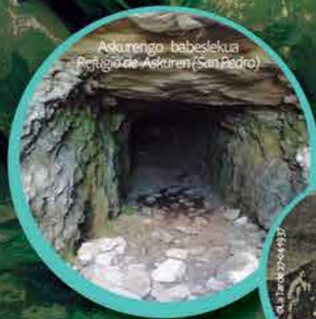
Askurengo babeslekua Refugio de Askuren (San Pedro)